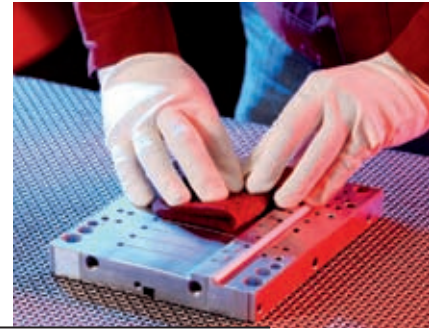
Durchführung einer Endfinishbehandlung

Ein optimaler Poliervorgang schafft die besten Voraussetzungen für eine spätere Oberflächenbehandlung.