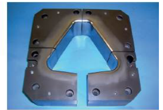
Werkstoff: CPOH Plus